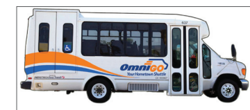
Los vehículos OmniGo y el servicio serán reemplazados el 8 de septiembre.

También hay un cambio en los vehículos que dan servicio a estas nuevas rutas. Los minibuses blancos, (a la derecha), con el singular logo dorado y azul, que se utilizaron en todas las rutas de OmniGo serán reemplazados por minibuses del mismo tamaño, pero con un diseño de color verde, azul y blanco, (arriba). Estos minibuses son lo que llamamos "vehículos flexibles". Estos vehículos flexibles brindarán servicio en las nuevas Rutas 305, 319 , así como en las recientemente renombradas Rutas 312 y 329 . Estos vehículos flexibles también brindarán servicio de fin de semana en las Rutas 84 y 88 .